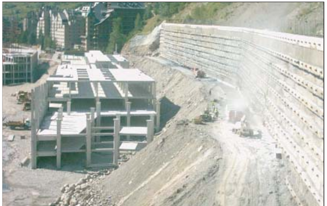
Imagen de archivo de las obras en el Valle de Ruda.