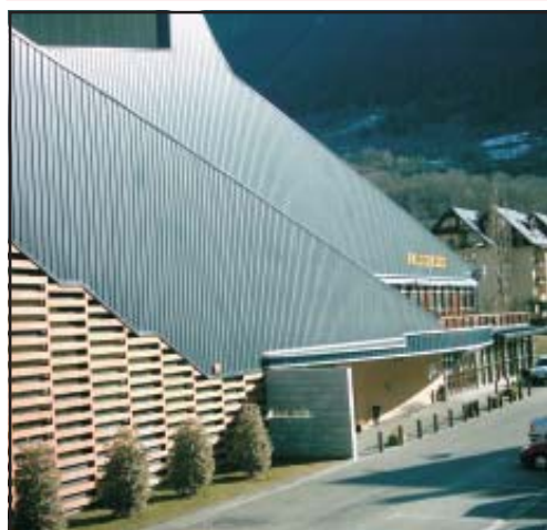
La Biblioteca General de Vielha.