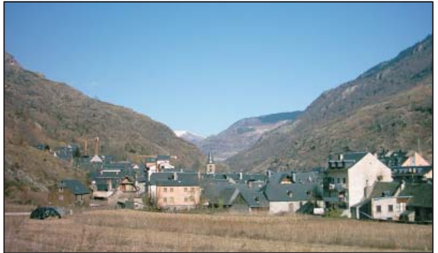
Vista de Bossòst des del paratge conegut com a Arnan.