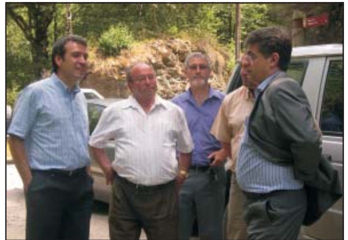
Un momento de la visita.

El Departamento de Agricultura prevé que las obras de pavimentación de los cuatro kilómetros entre ambas poblaciones dure cinco meses.