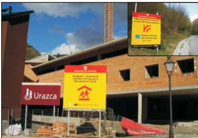
El IES d'Aran en Vielha. Arriba, mejora de la carretera del Toran.