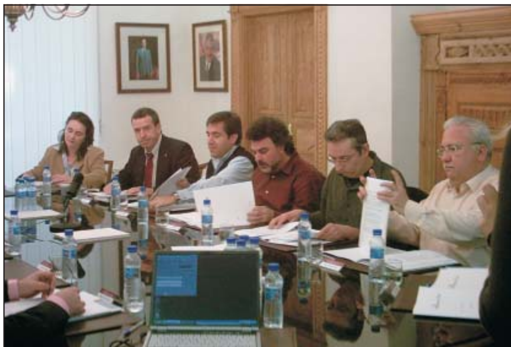
Eth grop d'UA en Conselh Generau.

Aguesta mocion rebotjada se base ena redaccion d'un Catalòg qu'aurie un inventari des valors paisatgistics e ua